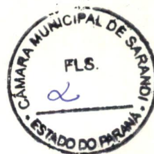
Cilas Souza Morais AUTOR

Sala das Sessões da Câmara Municipal, 19 de novembro de 1.998.