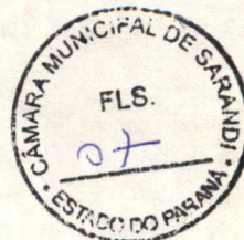
CLEITON DAMASCENO DO CARMO Autor

Sala das Sessões da Câmara Municipal, 14 de março de 2001.