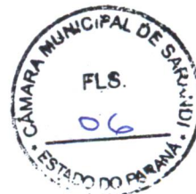
APARECIDO FARIAS SPADA Prefeito Municipal