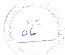
APARECIDO FARIAS SPADA Prefeito Municipal