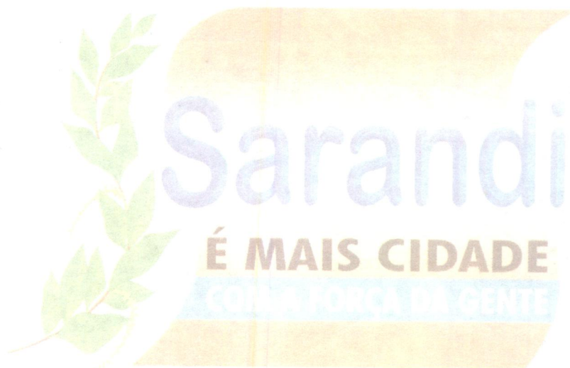
APARECIDO FARIAS SPADA Prefeito Municipal