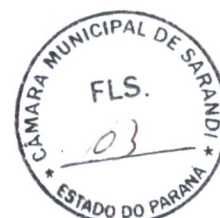
APARECIDO FARIAS SPADA Prefeito Municipal