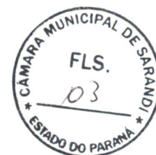
APARECIDO FARIAS SPADA Prefeito Municipal