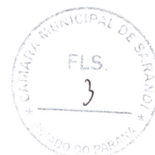
APARECIDO FARIAS SPADA Prefeito Municipal