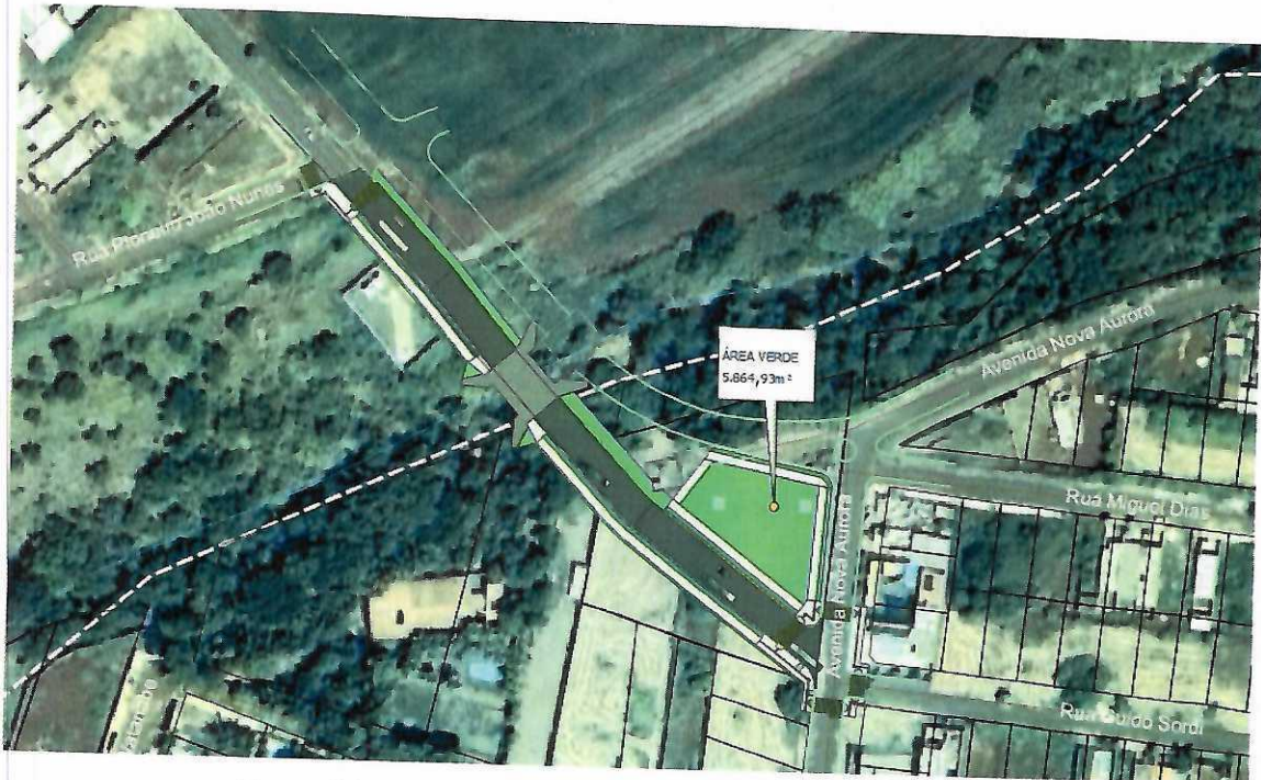
Figura 01 - Localização da área verde que será desafetada.

Dessa forma, solicitamos o encaminhamento desta minuta, para a Câmara dos Vereadores e permanecemos à disposição para quaisquer esclarecimentos que se fizerem necessários.