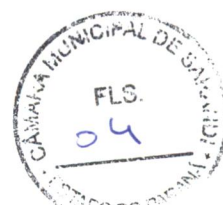
APARECIDO FARIAS SPADA Prefeito Municipal