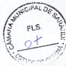
APARECIDO FARIAS SPADA Prefeito Municipal