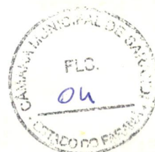
APARECIDO FARIAS SPADA Prefeito Municipal