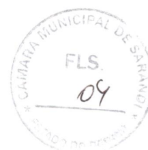
APARECIDO FARIAS SPADA Prefeito Municipal